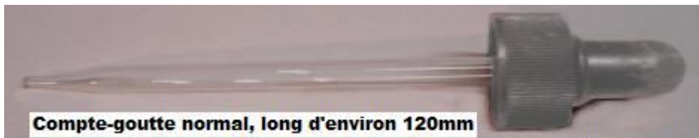
1. Figure 1: quand vous utilisez un compte-goutte normal, en verre, multipliez toujours le nombre de gouttes suggérées dans ce livre par 1,5.

Au cas où le monde arrête d'utiliser ces bouchons compte-goutte, la taille de leur orifice est de 0.180''x 0.180'' carré. L'orifice de l'embout d'un compte-goutte normal en verre est de 0.125'' de diamètre. Toutes les quantités de MMS données dans ces documents sont approximatives. Pour ceux qui sont plus scientifiques, 17 gouttes du bouchon compte-goutte en plastique égalent 1 ml c'est 1 cc). Il faut environ 25 gouttes d'un compte-goutte normal en verre pour faire 1 ml. L'eau n'a pas le même poids que le MMS, donc ne vous laissez pas égarer par les nombreux chiffres concernant les gouttes. Le MMS est 20% plus lourd que l'eau et cela change le nombre et la taille des gouttes pour un millilitre.