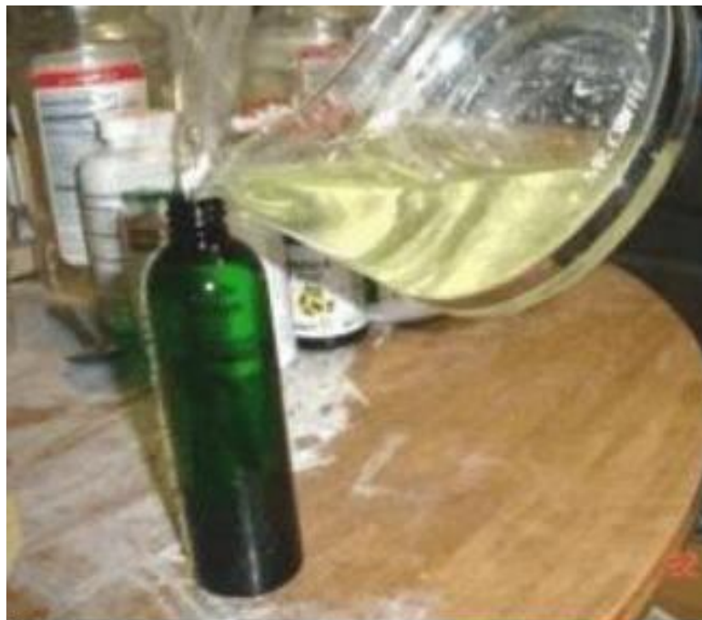
La bouteille est remplie à partir d'une caraffe de cafetière. Notez le liquide clair mais légèrement jaune du MMS.

6 ème étape : Ecrivez sur la bouteille « MMS » et la date de création avec le feutre noir. Laissez de la place pour la prochaine fois que vous utiliserez cette bouteille. Rappelez vous que vous ne devez pas laisser le MMS longtemps dans les bouteilles claires. Normalement pas plus d'une semaine. La lumière, même juste la lumière du jour commence à détériorer le MMS dans les bouteilles transparentes. Cette étape est juste temporaire dans le processus de fabrication du MMS.